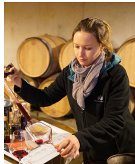
アメリー・ベルトール