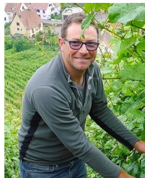
ジャン・ボクスレ

土壌 : 花崗岩、粘土石灰質、石灰質 栽培 : 減農薬農法 (リュット・レゾネ)、有機栽培