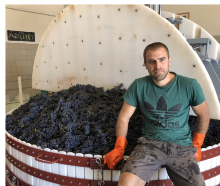
ジャン・フェリックス・ジョスラン