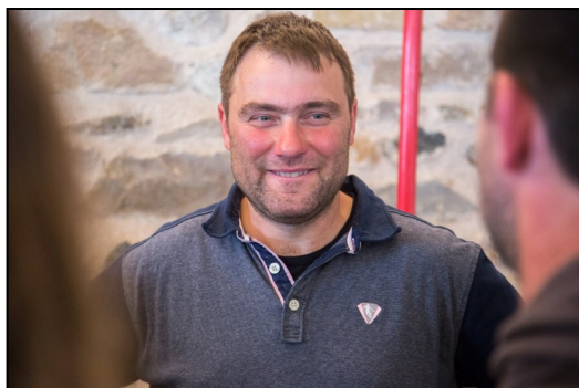
バティスト・ヴァレット

品種：シャルドネ 樹齢：70年 樽発酵後、そのままシュールリーで12年間熟成。ドメーヌ・ヴァレットのトップ・キュヴェ。ワイン名に付けられている”ムッシュ・ノリー”とは、18世紀に存在したこの地の所有者の名前。