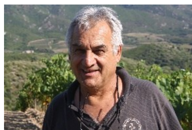
アントワヌ・アレナ