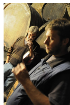
オリヴィエ・クラブ

コルナスの真髄を伝え続けるクラブ家は、JLシャープ、ライヤス、ペラン、ギガルと共にローヌ地方で5本の指に入る最高の生産家の1つ。