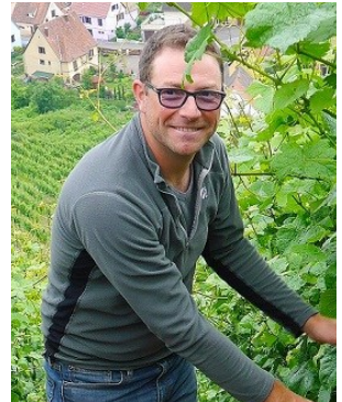
ジャン・ボクスレ

土壌 : 花崗岩、粘土石灰質、石灰質 栽培 : 減農薬農法（リュット・レゾネ）、有機栽培