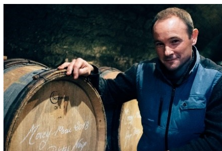
ステファン・マニャン