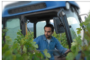
ジャン・バティスト・アレナ