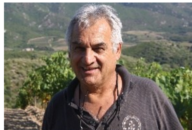
アントワヌ・アレナ