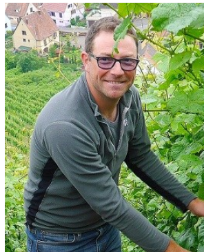
ジャン・ボクスレ

土壌 : 花崗岩、粘土石灰質、石灰質 栽培 : 減農薬農法（リュット・レゾネ）、有機栽培