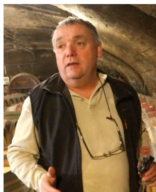
ジャンルイ・デュトレーヴ

品種：ガメイ セメントタンクを使用、野生酵母によりマセラシオン・カルボニック醸造。2年から5年落ちの樽で8ヶ月間熟成。ドメヌの目の前の畑で樹齢60~70年のヴィエイユ・ヴィーニュをセクションして造られる。